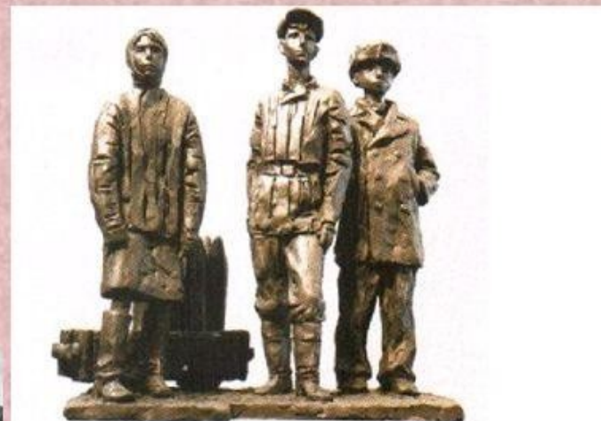
Памятник детям, работавшим на заводах Урала в годы войны. (проект) Скульптор А.Г. Антонов (2004г.)

У целого поколения, рожденного с 1928 по 1945 год было украдено детство.