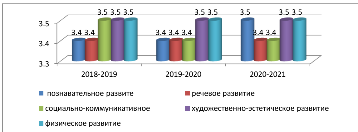
Уровень развития интегративных качеств в баллах.